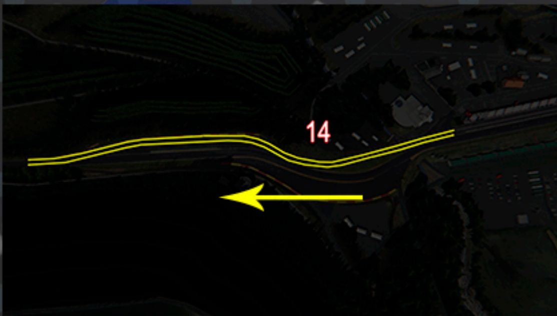
Salida de box