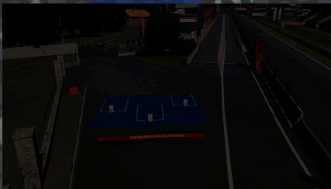
Zona de Podio