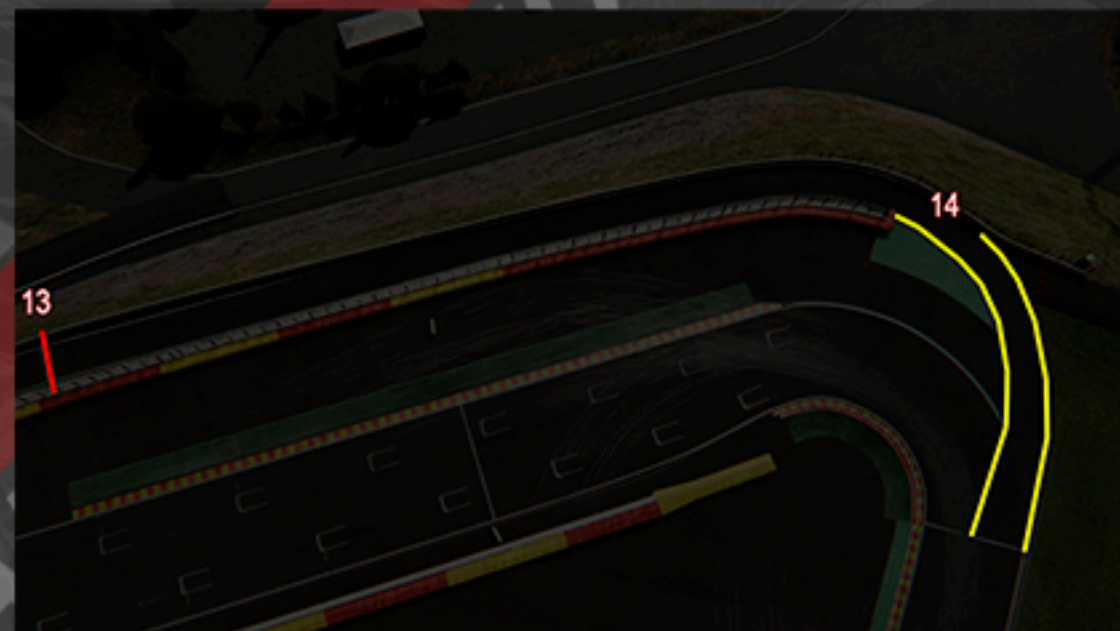
Entrada a box