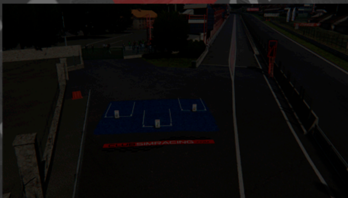
Zona de Podio