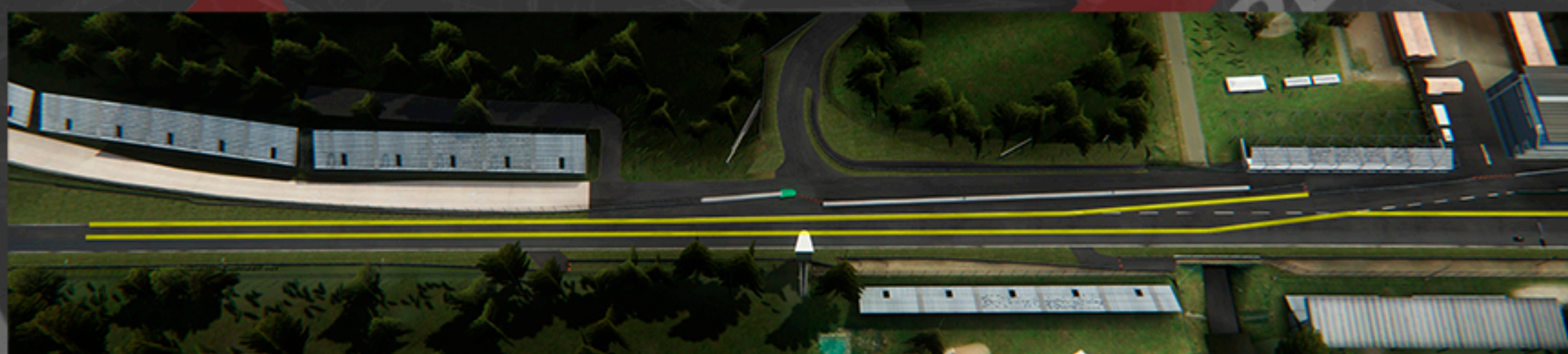
SALIDA DE BOX