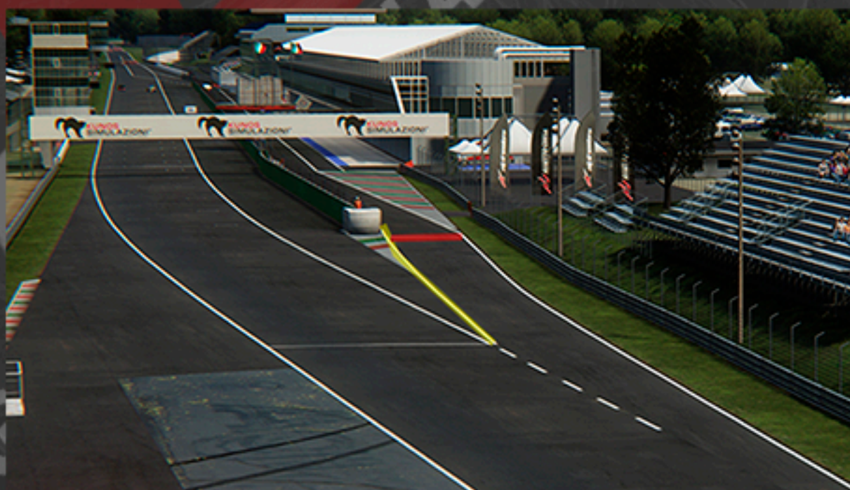
ENTRADA DE BOX